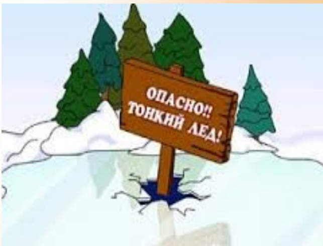
Опасные места на льду водоемов